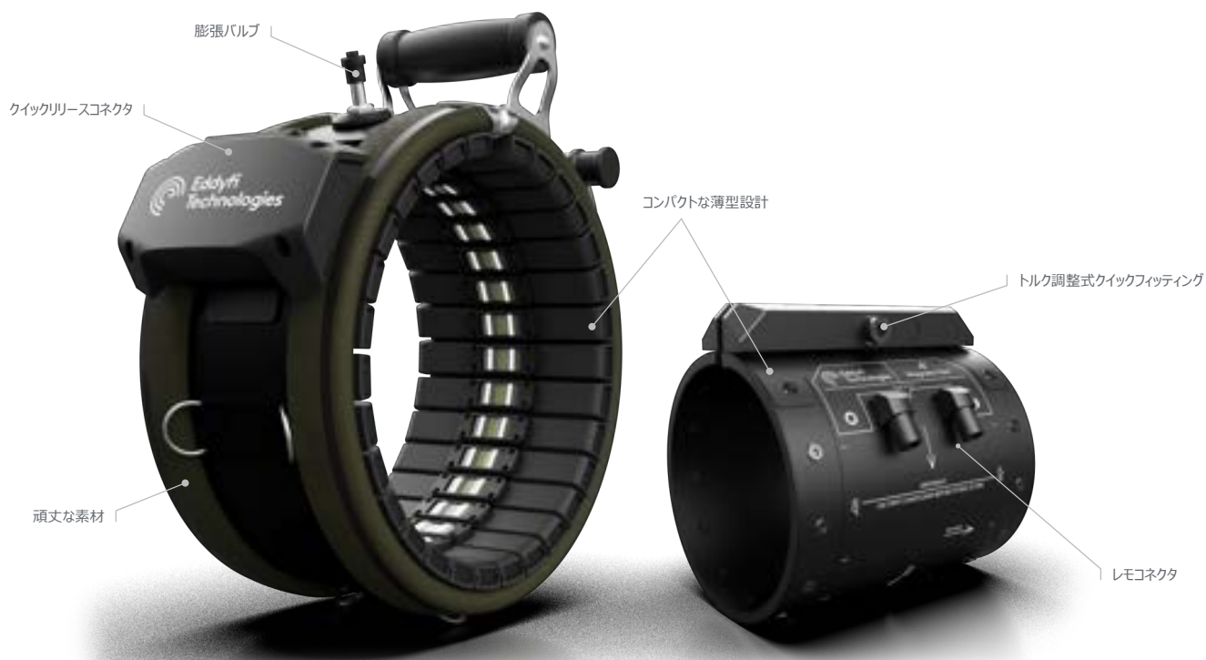
PIEZO ツール 6 - 72 インチ

Sonyksは非常に用途の広いシステムであり、長距離超音波試験に加えて、短距離および中距離機能のおかげで、オペレーターはより多くのアプリケーションに対応できます。例えば、新しい128 kHzの磁歪カラーを使用して、フランジ付きパイプを効率的に検査します。